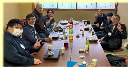
先日行われた親睦会の様子です😊